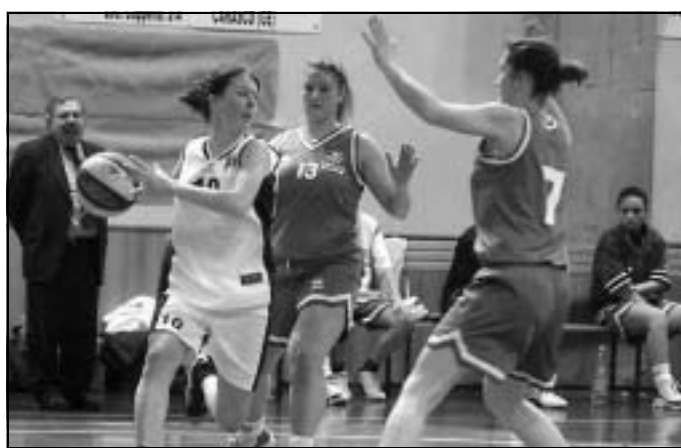
La Polysport in azione offensiva, pressata dalle avversarie

«Sara è risultata essere letteralmente immarcabile - confessa Na-